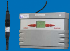
Raumklima- überwachung (optional)